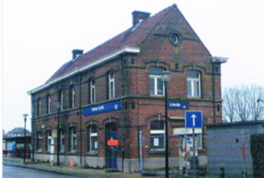
Foto's genomen op 26 februari, daags vóór de sloot.