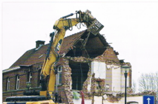
En zo werd Lierde een stukje erfgoed armer.

De periode dat hij hier verbleef hebben we niet kunnen achterhalen, maar het is mogelijk dat hij de eerste stationschef was.